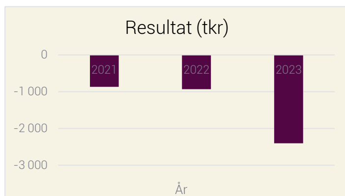
Diagram 3: Ekonomiskt resultat för Barnen Framför Allt

Adoptionsorganisationernas förmedlingsverksamhet finansieras främst av adoptionsavgifter men också av statsbidrag som fördelas av MFoF. Under 2024 beviljades Barnen Framför Allt statsbidrag med 285 000 kronor som stöd till arbetet med adoptionsförmedling.